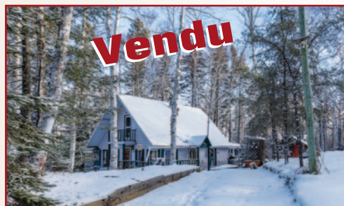
1020, CH. POINTE-FINE, SAINT-MICHEL-DES-SAINTS