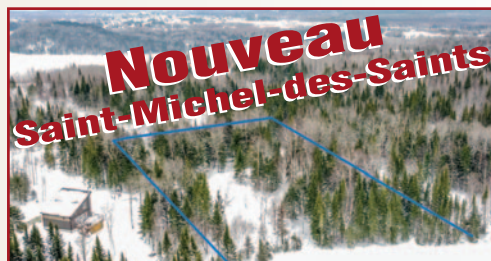
CHEMIN DES GRANDS-DUCS, 65 000 P 2 , BORD DE LAC, ÉLECTRICITÉ, 4 KM DU VILLAGE, PRÈS DU DÉBARCADÈRE BAIE DOMINIQUE, #15918167, 99 000 $