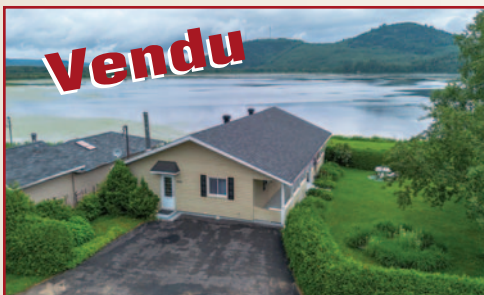
7870, CH. DU LAC-KÁIGAMAC, SAINT-MICHEL-DES-SAINTS