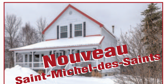
3601, CH. ST-IGNACE N, VUE PARTIELLE DU LAC TAUREAU, 3 CH, 2 SDB, SOLARIUM, VÉRANDA, TOIT TÔLE, GARAGE 20' X 30', #18035281, 498 000 $