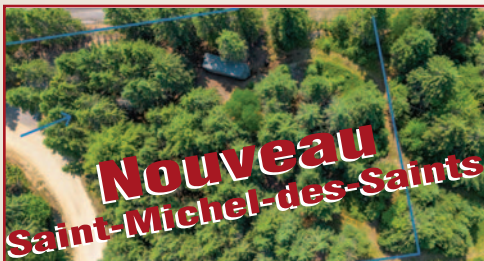
ACCÈS NOTARIÉ AU LAC TAUREAU, CH. CAROLINE, 41,800 P 2 , ENTRÉE EN GRAVIER, PLAN D'IMPLANTATION SEPTIQUE 2022, #27999594, 112 000 $