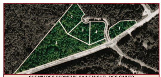
CHEMIN DES RÉSINEUX, SAINT-MICHEL-DES-SAINTS 5 TERRAINS DISPONIBLES, 39 500 À 224 000 P 2 , ENTRE 54 500 $ ET 82 500 $ + TX, 6 KM DU VILLAGE, 2 KM PLAGE MUNICIPALE ET MARINA, SENTIERS QUAD ET MOTONEIGE