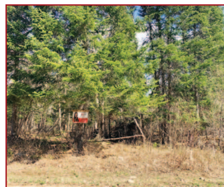
4 TERRAINS, DOM. LAGRANGE, SAINT-MICHEL-DES-SAINTS CH. DU CENTRE, 26 000 $ + TAXES ET 20 500 $ + TAXES, CH. DES HAUTEURS, 26 000 $, 20 CH. DU SOMMET, 28 500 $ + TAXES