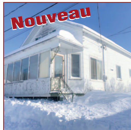
60, RUE DU COLLÈGE, SAINT-ZÉNON 4 CAC, VÉRANDA, GARAGE, 9765 P 2 , # 23354634, 118 000 $