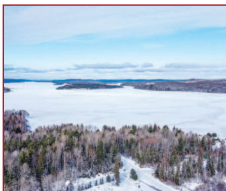
3 TERRAINS, DOM. VAILLANCOURT, ACCÈS AU LAC TAUREAU POSSIBILITÉ DE LOUER UN QUAI, # 15820741, 108 000 $ + TAXES, # 11680634, 108 000 $ + TAXES, # 20130662, 75 000 $ + TAXES