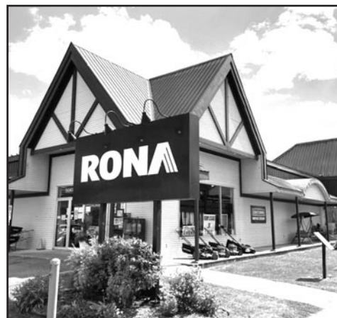
Le Rona de Saint-Michel-des-Saints

630, rue Brassard Saint-Michel-des-Saints 450 833-6324