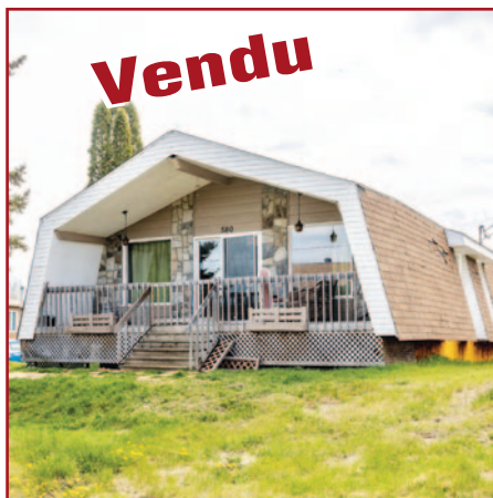
580, RUE ST-GEORGES SAINT-MICHEL-DES-SAINTS