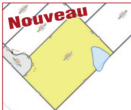
TERRAIN CH. DE LA JOIE, DOM. LAGRANGE SAINT-MICHEL-DES-SAINTS 130 000 P 2 , 6 KM DU VILLAGE, # 11 621 409, 38 000 $